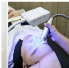
マグネット式ですので様々な機器と併用して施術可能です