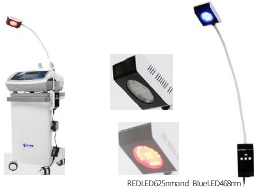
REDLED625nm and BlueLED468nm