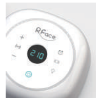
高周波レベル設定