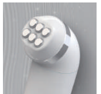
バイブレーション