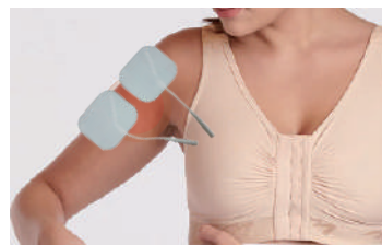
Gel pads (Option)