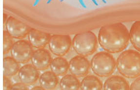
コラーゲンの再成形と肌の引き締め