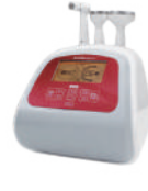
セルキュム 温熱バキューム