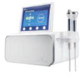
ソノケア 高密度超音波