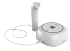
Rフェイス 高周波美顔器