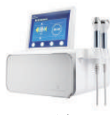
ソノケア 高密度超音波