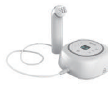
Rフェイス 高周波美顔器