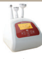
セルキウム 温熱バキューム